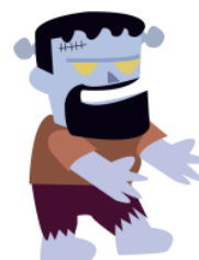
Un monstre barbu