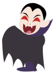
Un vampire (Dracula)

Groupe 👂 : écoute la chanson et colorie les étiquettes des mots que tu entends.