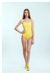
un maillot de bain