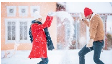
faire une bataille de boules de neige