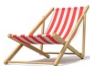
une chaise longue