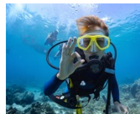
faire de la plongée