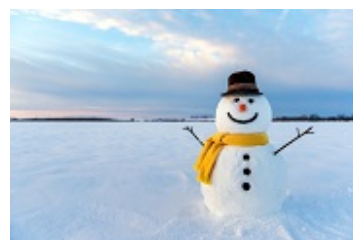
faire un bonhomme de neige