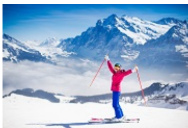
faire du ski